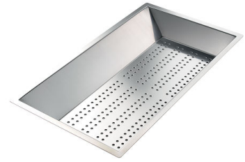
Vaschetta forata inox 8151 000