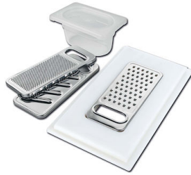
Kit grattugia con supporto per anello e vassoio di raccolta alimenti 8159 101